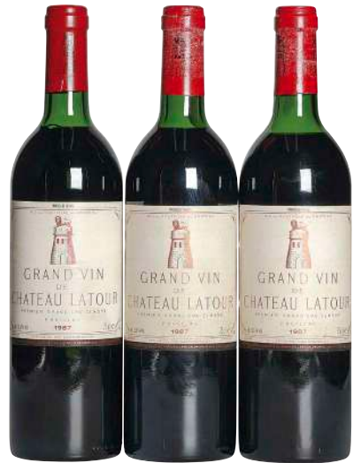
4 Chateau Latour 1987 (3) Pauillac VTS×2 TS×1 ラベルしわ×3