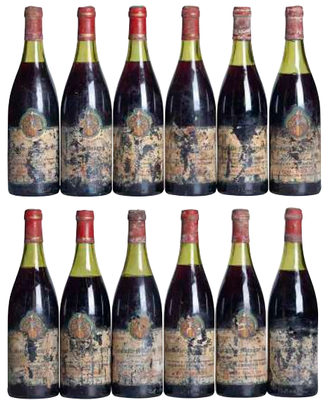
108 Chambolle Musigny 1978 (12) Grivelet Pere & Fils 35mm×7 40mm×4 50mm×1 ラベル破損大×12 ラベル汚れ大×12