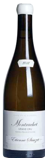
180 Montrachet 2012 Grand Cru-Etienne Sauzet 30mm