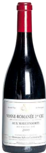
336 Vosne Romanee 2009 1er Cru Aux Malconsorts-Sylvain Cathiard & Fils