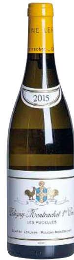
175 Puligny Montrachet 2015 1er Cru Les Pucelles-Domaine Leflaive 15mm