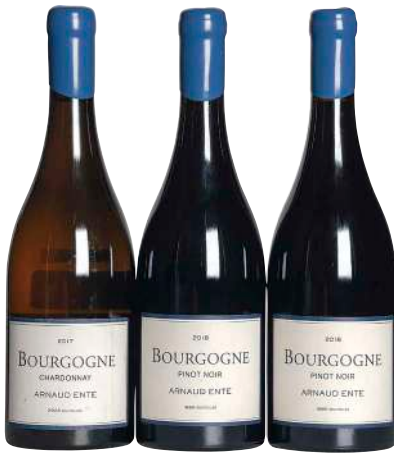
107 Bourgogne Blanc 2017 Arnaud Ente Bourgogne Rouge 2018 (2) Arnaud Ente