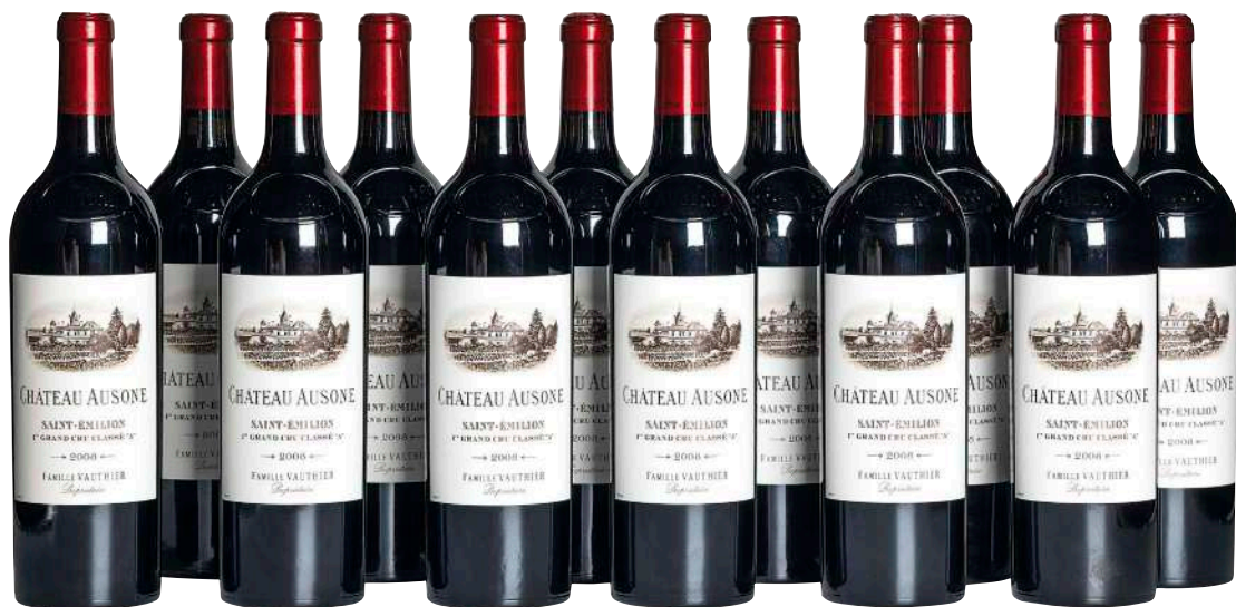
103 Chateau Ausone 2008 (12) Saint Emilion