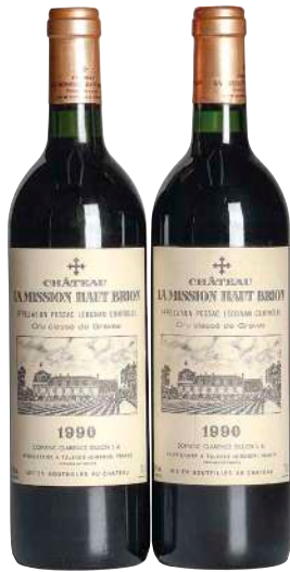
8 Chateau La Mission Haut Brion 1990 (2) Pessac Leognan