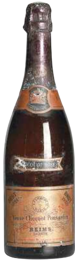
1 Champagne Veuve Clicquot Brut Rose Millesime 1928 Veuve Clicquot ネックラベル傷 ラベル傷