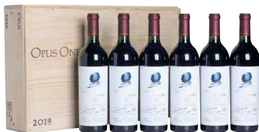
253 Opus One 2019 (6) Napa Valley-Opus One