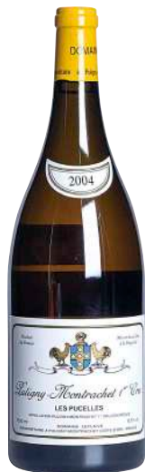
174 Puligny Montrachet 2004 (1500ml) 1er Cru Les Pucelles-Domaine Leflaive 15mm