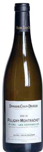
177 Puligny Montrachet 2014 1er Cru Les Demoiselles-Michel Colin Deleger