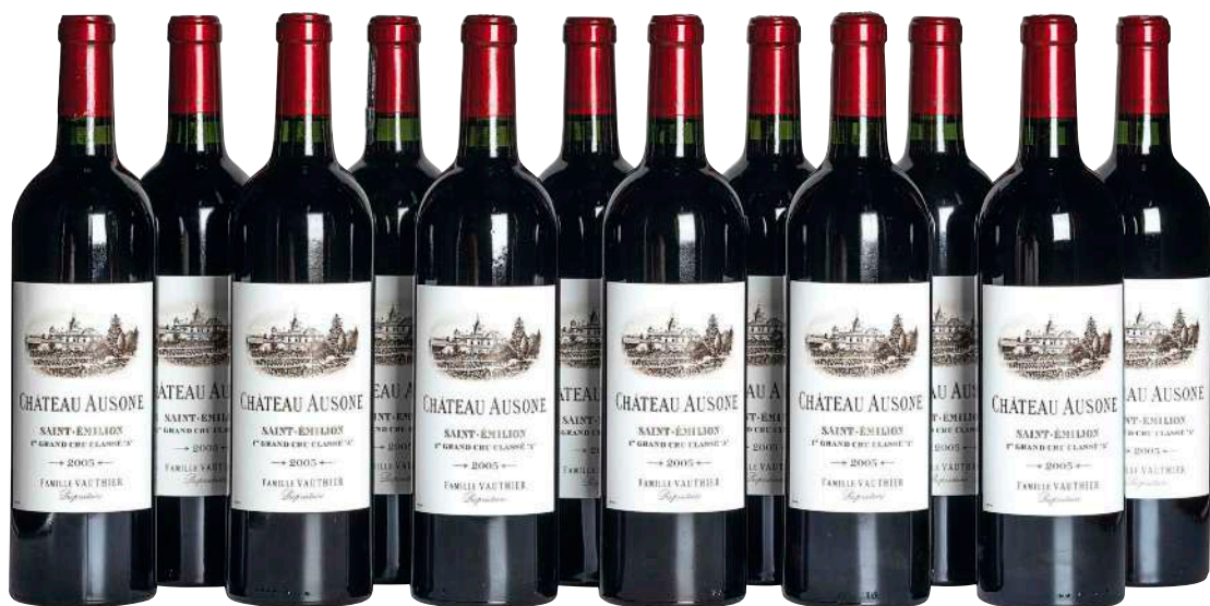
102 Chateau Ausone 2005 (12) Saint Emilion