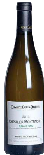
176 Chevalier Montrachet 2014 Grand Cru -Michel Colin Deleger