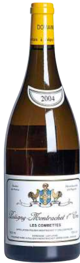
173 Puligny Montrachet 2004 (1500ml) 1er Cru Les Combettes-Domaine Leflaive