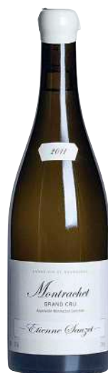
179 Montrachet 2011 Grand Cru-Etienne Sauzet 25mm