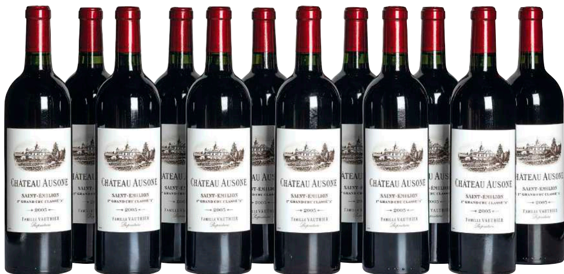
101 Chateau Ausone 2005 (12) Saint Emilion