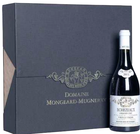
252 Echezeaux Vieilles Vignes 2011 Grand Cru-Mongead Mugneret