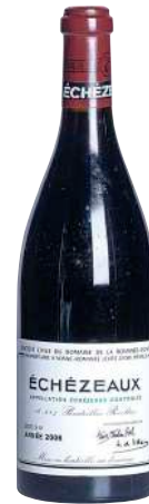
109 Echezeaux 2006 Grand Cru-D.R.C.