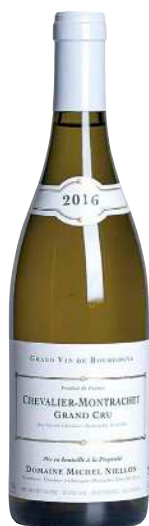
178 Chevalier Montrachet 2016 Grand Cru-Michel Niellon 15mm