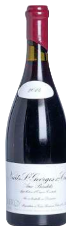
254 Nuits Saint Georges 2014 1er Cru Aux Boudots-Domaine Leroy