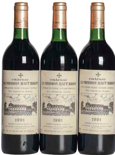
9 Chateau La Mission Haut Brion 1991 (3) Pessac Leognan