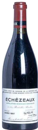
126 Echezeaux 1997 Grand Cru-D.R.C.