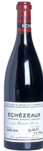
127 Echezeaux 2010 Grand Cru-D.R.C.