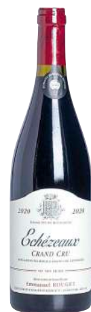
255 Echezeaux 2020 Grand Cru-Emmanuel Rouget