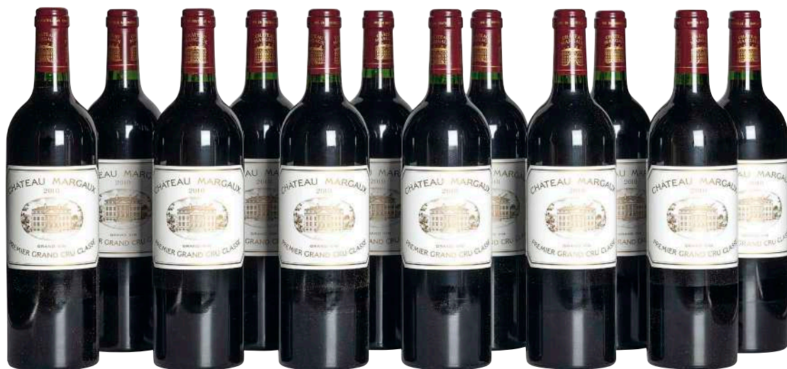
100 Chateau Margaux 2010 (12) Margaux