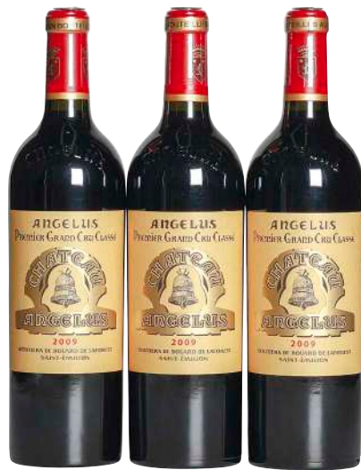
11 Chateau Angelus 2009 (3) Saint Emilion