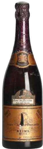
2 Champagne Veuve Clicquot Brut Millesime 1953 Veuve Clicquot ラベル傷大 ラベル汚れ