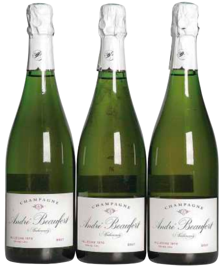
3 Champagne Ambonnay Brut 1976 (3) Andre Beaufort ラベル汚れわずか×3 シャンパーニュでいち早くピオロジックを導入した造り手。