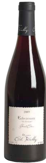
337 Echezeaux du Dessus 2009 Grand Cru-Cecile Tremblay

デュ・ドゥシュはグラン・エシェゾーに隣接する区画。 所有する面積はたった0.2haのみ。