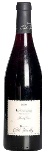
338 Echezeaux du Dessus 2009 Grand Cru-Cecile Tremblay