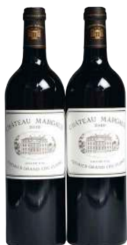
290 Chateau Margaux 2019 (2) Margaux