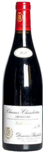
335 Charmes Chambertin Vieilles Vignes 2010 Grand Cru-Domaine Bachelet