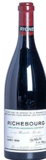
128 Richebourg 1998 Grand Cru-D.R.C.