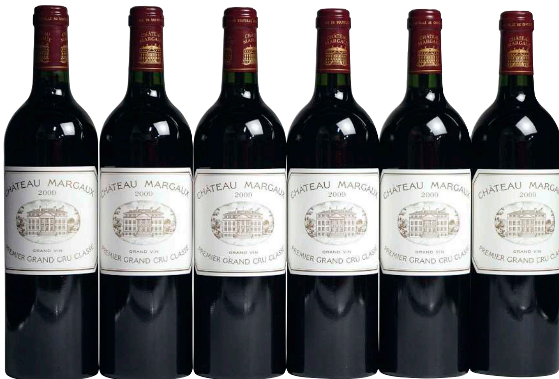
288 Chateau Margaux 2009 (6) Margaux