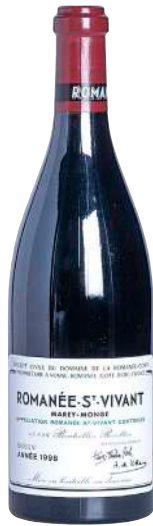
125 Romanee Saint Vivant 1998 Grand Cru-D.R.C.