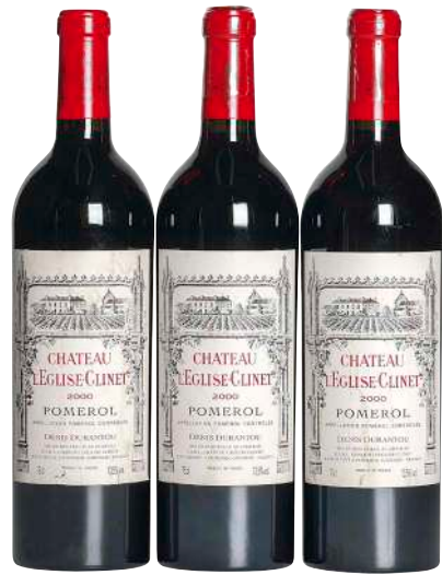
10 Chateau l'Eglise Clinet 2000 (3) Pomerol ラベルしみ×3 ラベル傷×1