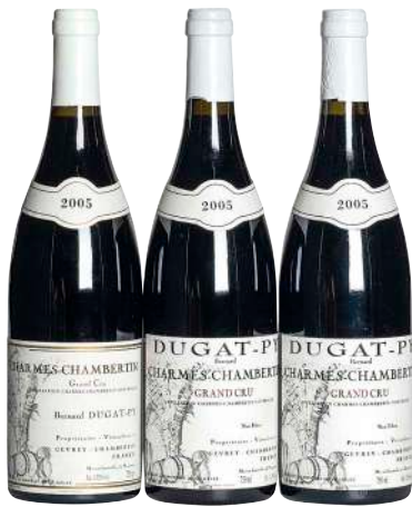
106 Charmes Chambertin 2005 (3) Grand Cru-Bernard Dugat Py ラベル違い×1