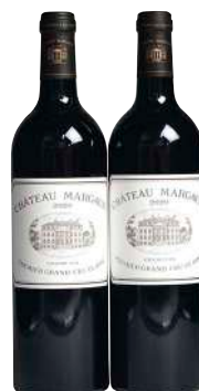
291 Chateau Margaux 2020 (2) Margaux